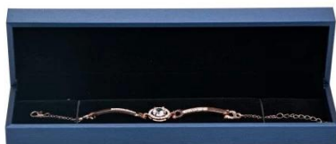
bracelet box: 22*5.5*3.3