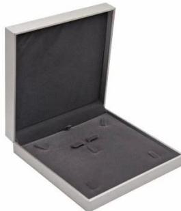
set box: 19*19*4.5