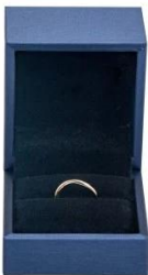
ring box: 6*6.5*5.1

*All off the size are measured by hand, as for different measurement method Please refer to actual products if there is any error (unit: cm)