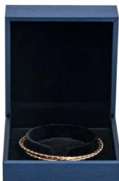
bangle box: 9*9*4