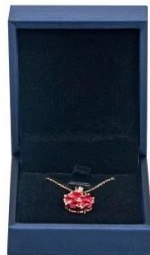
pendant box: 7.4*8.4*3.6