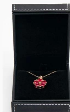
pendant box: 7*8.3*3.5