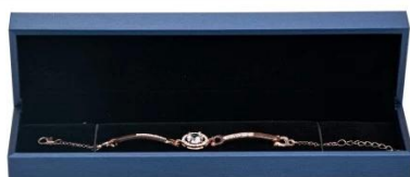
bracelet box: 22*5.5*3.3