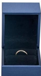
ring box: 6*6.5*5.1