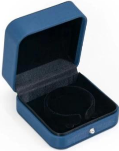
bangle box: 9*9*4