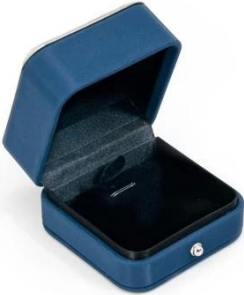
pendant box: 7*7*4.5