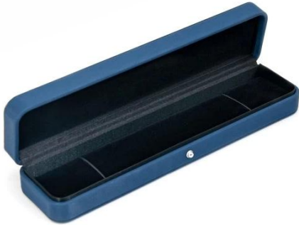
bracelet box: 23.8*5.8*3