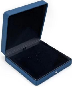
set box: 19*19.5*4.3